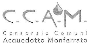
Consorzio Comuni Acquedotto Monferrato